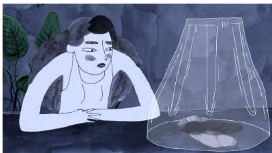
Inès , d'Élodie Dermange (France/Suisse, 2019, 4')

Premières à la Nuit du Court métrage de Genève Vendredi 17 septembre 2021 dès 20h aux Cinémas du Grütli Informations et préventes : www.nuitducourt.ch/geneve-2021