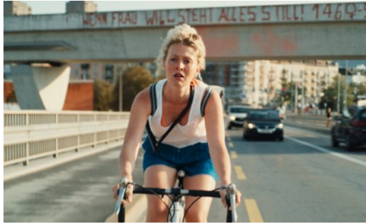
ÜBER WASSER de Jela Hasler (Suisse) Prix du Jury des jeunes de Genève, NDC 2022

GENÈVE 16.9 • MORGES 23.9 • YVERDON-LES-BAINS 23.9 FRIBOURG 30.9 • VEVEY 30.9 • MASSAGNO 14.10 NEUCHÂTEL 21.10 • LA CHAUX-DE-FONDS 28.10 SIERRE 04.11 • DELÉMONT 11.11 • MONTHEY 11.11 25 ANS DE LA NUIT DU COURT DE LAUSANNE 18.11