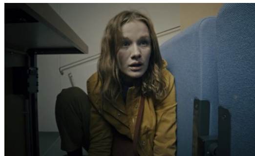
INCIDENT AT SCHOOL de Jacob Thomas Pilgaard (Danemark) Prix RTS du Public de la Nuit du Court de Lausanne 2022